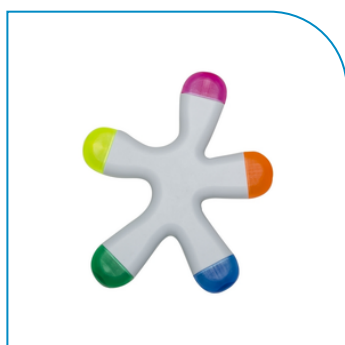
MARCA TEXTO SPLASH COM 5 CORES PERSONALIZADO