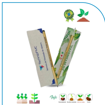
LÁPIS PERSONALIZADO SEMENTE