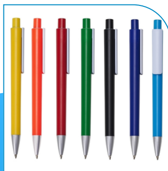
CANETA PLÁSTICA PARA BRINDE