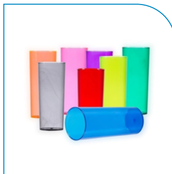
COPO LONG DRINK PERSONALIZADO 330ML