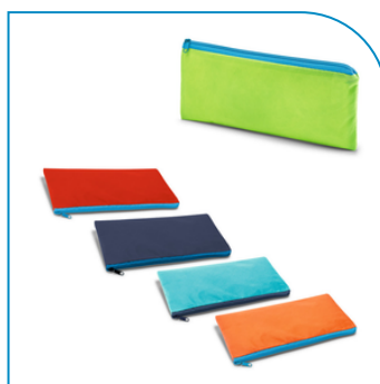
ESTOJO PARA LÁPIS PERSONALIZADO