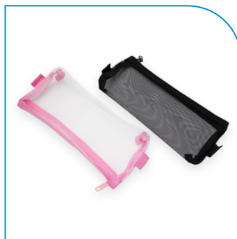
ESTOJO DE NYLON PARA BRINDE