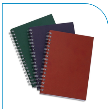
CADERNO PERSONALIZADO DE CAPA KRAFT