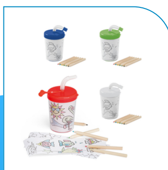
COPO PLÁSTICO INFANTIL PARA COLORIR PERSONALIZADO