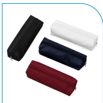
ESTOJO DE NYLON PERSONALIZADO