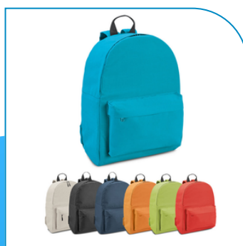
MOCHILA PARA ESCOLA E EMPRESAS PERSONALIZADA