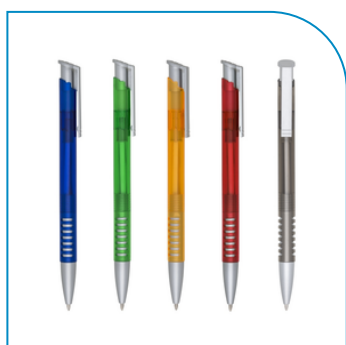
CANETA PLÁSTICA PERSONALIZADA CORPORATIVA