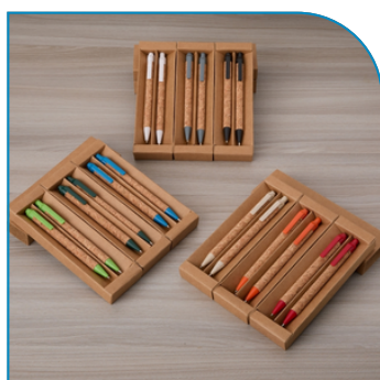
KIT ECOLÓGICO CANETA E LAPISEIRA CORTIÇA PERSONALIZADO