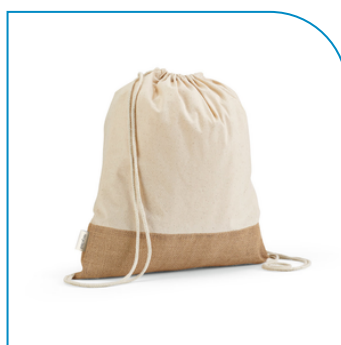
SACOLA TIPO MOCHILA EM ALGODÃO E POLIÉSTER RECICLADOS PARA BRINDE