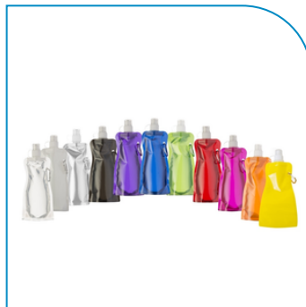
SQUEEZE DOBRÁVEL 450ML MOSQUETÃO PARA BRINDE