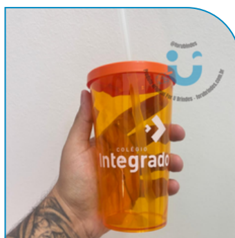
COPO PERSONALIZADO DE ACRÍLICO COM TAMPA E CANUDO