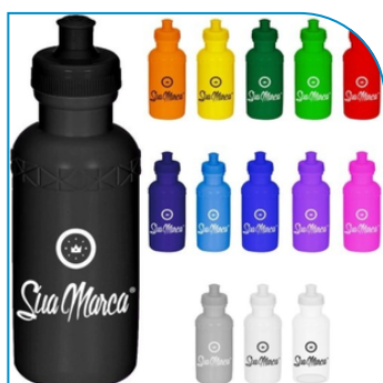
SQUEEZE PROMOCIONAL DE PLÁSTICO 500ML