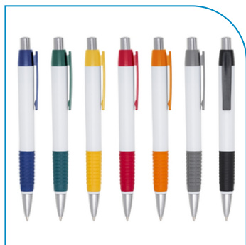
CANETA PLÁSTICA COM LOGOTIPO