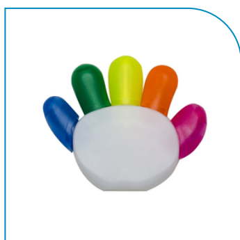
MARCA TEXTO BRANCO FORMATO MÃO COM 5 CORES COM LOGOTIPO