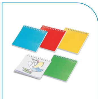
CADERNO PERSONALIZADO PARA COLORIR