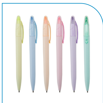
CANETA PLÁSTICA MARCA TEXTO PROMOCIONAL