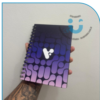
CADERNO PERSONALIZADO SOB MEDIDA PARA BRINDES