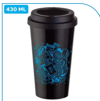
COPO PERSONALIZADO DE PLÁSTICO PARA CAFÉ PERSONALIZADO