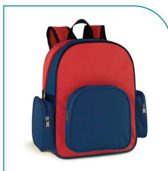
MOCHILA ESCOLAR PERSONALIZADA