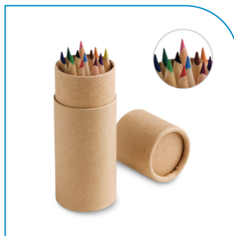
CAIXA PERSONALIZADA COM 12 LÁPIS DE COR