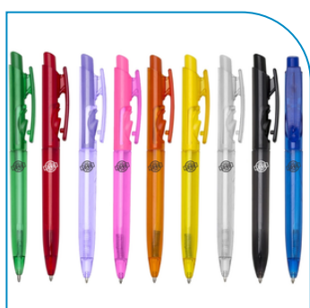
CANETA PLÁSTICA TRANSLUCIDA PERSONALIZADA