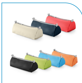
ESTOJO PARA LÁPIS PROMOCIONAL