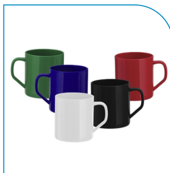
CANECA PLÁSTICA 400ML PROMOCIONAL