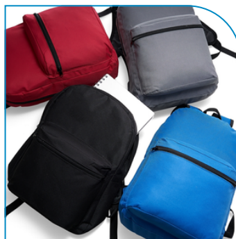
MOCHILA NYLON 17L PERSONALIZADO