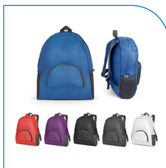
MOCHILA DOBRÁVEL PERSONALIZADA