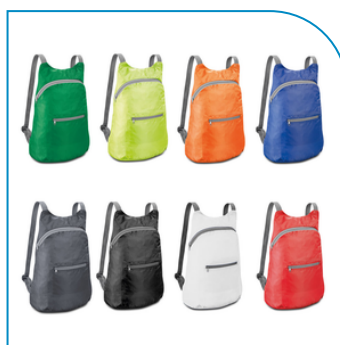
MOCHILA DOBRÁVEL PERSONALIZADA