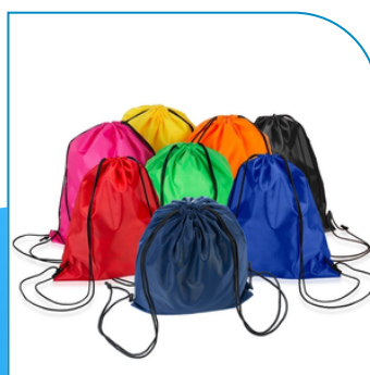
SACOCILA EM POLIÉSTER PARA EMPRESAS