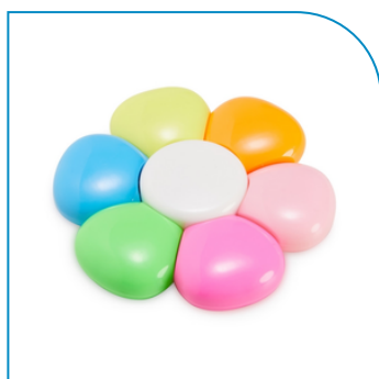
MARCA TEXTO FLOR PROMOCIONAL