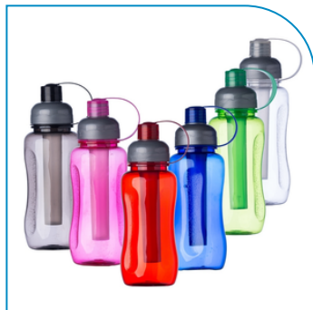
LÁPIS PERSONALIZADO SEMENTE