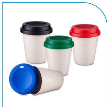
COPO FIBRA DE ARROZ 350ML COM LOGOTIPO