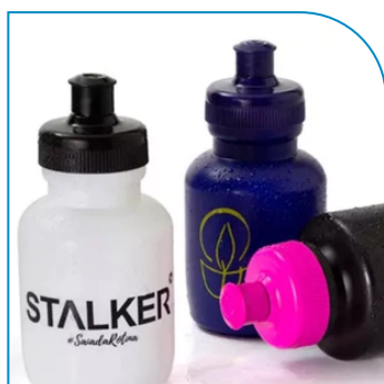
SQUEEZE PROMOCIONAL DE PLÁSTICO 300ML