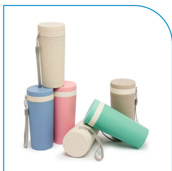
COPO FIBRA DE BAMBU 350ML COM LOGOTIPO