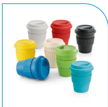
COPO FIBRA DE BAMBU 380ML PERSONALIZADO COM LOGO