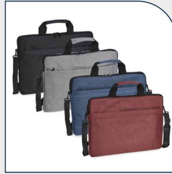
PASTA PARA NOTEBOOK 15'6 DE POLIÉSTER PROMOCIONAL