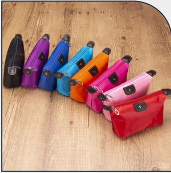
NECESSAIRE EM POLIÉSTER IMPERMEÁVEL PROMOCIONAL