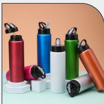
SQUEEZE PERSONALIZADO DE ALUMÍNIO 800ML