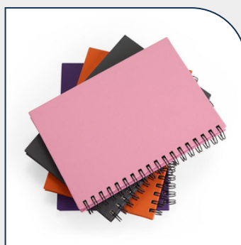
CADERNO CAPA EMBORRACHADA PROMOCIONAL