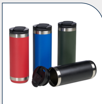
COPO TÉRMICO 550ML PERSONALIZADO