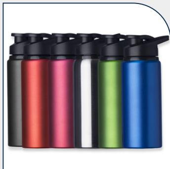
SQUEEZE ALUMÍNIO FOSCO 650ML PARA EMPRESAS