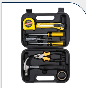
KIT FERRAMENTA ESTOJO COM 8 PÇS PROMOCIONAL