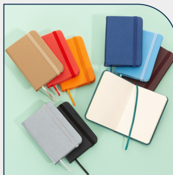
MINI CADERNETA SINTÉTICA BRILHANTE PERSONALIZADO