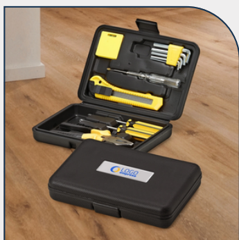
KIT FERRAMENTA 11 PÇS ESTOJO PLÁSTICO PERSONALIZADO