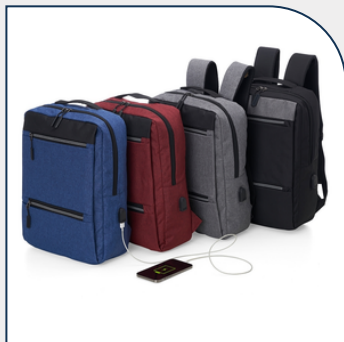
MOCHILA DE NYLON USB 20L PARA EMPRESAS