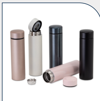
GARRAFA TÉRMICA 500ML PARA BRINDE