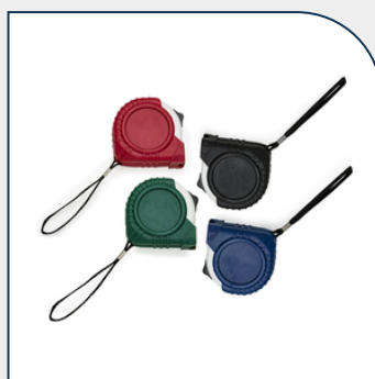
TRENA DE 3M COM LOGOTIPO