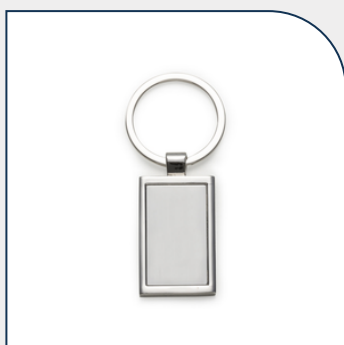
CHAVEIRO METAL RETANGULAR PARA EMPRESAS