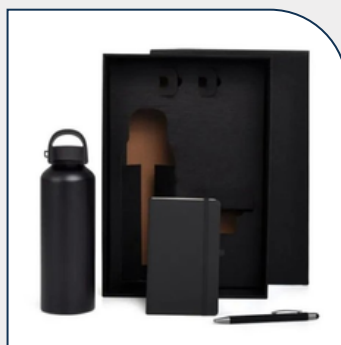
KIT BOAS VINDAS PRETO 3 PÇS PERSONALIZADO