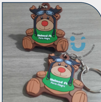
CHAVEIRO EMBORRACHADO PERSONALIZADO EM ALTO RELEVO