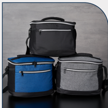
BOLSA TÉRMICA 10L PARA EMPRESAS