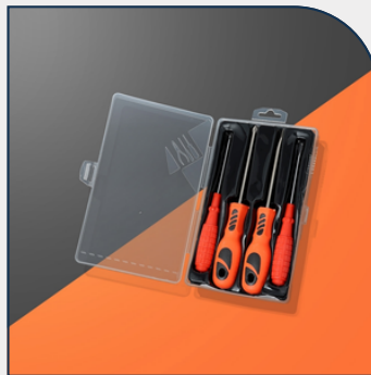
KIT FERRAMENTA PERSONALIZADO 4 PEÇAS