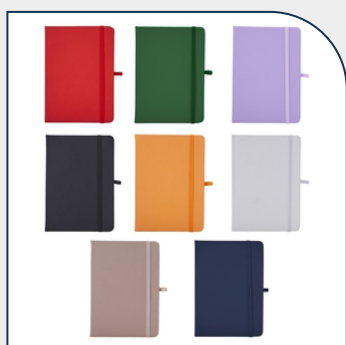
CADERNETA EMBORRACHADA PERSONALIZADA COM LOGOTIPO