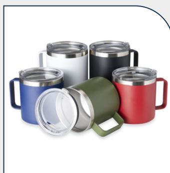
CANECA TÉRMICA 450ML PROMOCIONAL