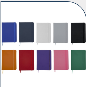
CADERNETA EMBORRACHADA PERSONALIZADA