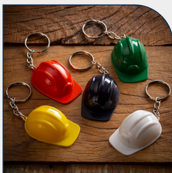
CHAVEIRO CAPACETE EPI PERSONALIZADO