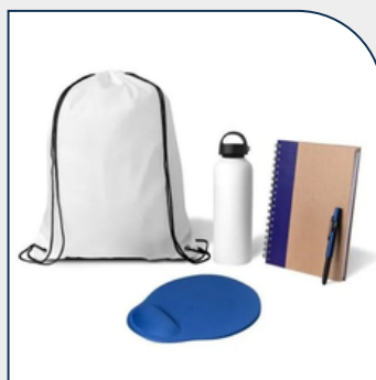
KIT BOAS VINDAS 5 PÇS BRANCO/AZUL PERSONALIZADO