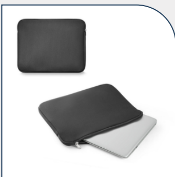
PASTA PERSONALIZADA PARA NOTEBOOK