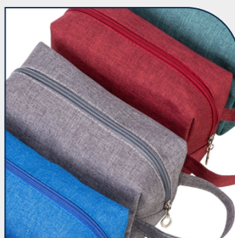
NÉCESSAIRE DE NYLON PARA EMPRESAS