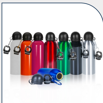
SQUEEZE INOX 500ML COM BICO E MOSQUETÃO-AZUL COM LOGOTIPO