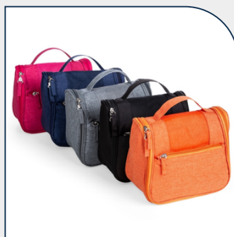
NECESSAIRE ORGANIZADORA COM LOGOTIPO