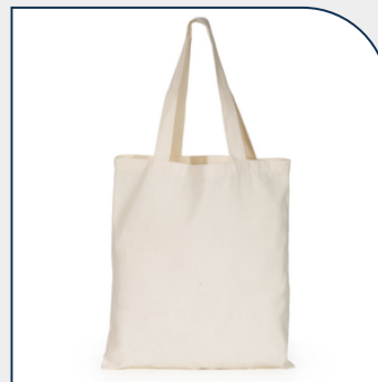
SACOLA DE ALGODÃO PERSONALIZADO