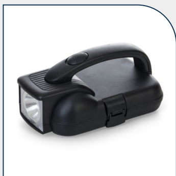
KIT FERRAMENTA ESTOJO COM LANTERNA PARA EMPRESAS