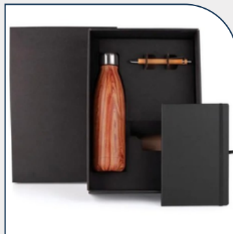
KIT BOAS VINDAS 3 PÇS PERSONALIZADO