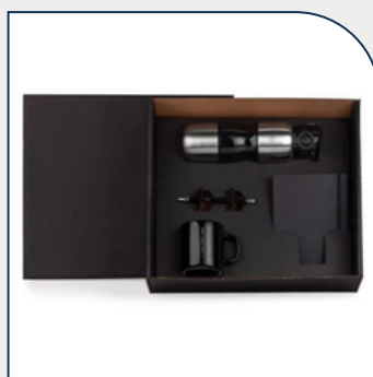
KIT BOAS VINDAS 4 PÇS PERSONALIZADO