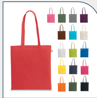
SACOLA PERSONALIZADA DE ALGODÃO (140 G/M²)