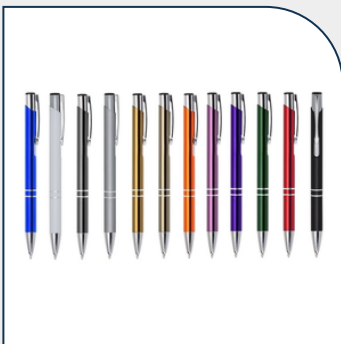
CANETA DE METAL PARA BRINDES PROMOCIONAIS