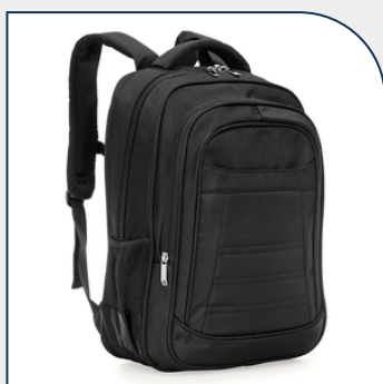
MOCHILA POLIÉSTER 27L PARA BRINDE