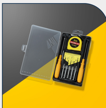
KIT FERRAMENTA PERSONALIZADO 8 PEÇAS