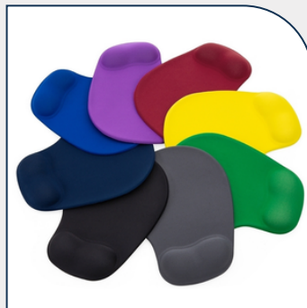
MOUSE PAD COM ALMOFADA PROMOCIONAL