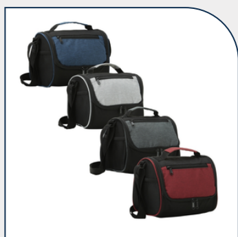
BOLSA TÉRMICA 7L COM LOGOTIPO