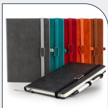
BLOCO DE ANOTAÇÕES EMBORRACHADO PARA BRINDE