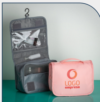
NECESSAIRE ORGANIZADORA PROMOCIONAL