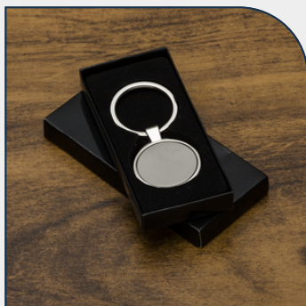
CHAVEIRO DE METAL REDONDO COM LOGOTIPO