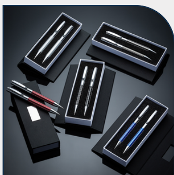
KIT CANETA E LAPISEIRA DE METAL PARA EMPRESAS