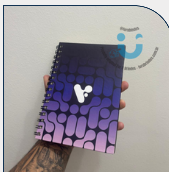
CADERNO PERSONALIZADO SOB MEDIDA PARA BRINDES