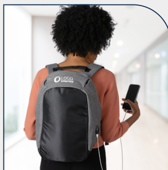
MOCHILA ANTI-FURTO USB 24L PROMOCIONAL