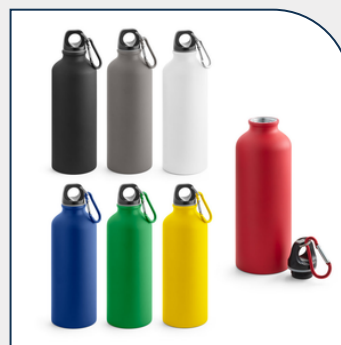
SQUEEZE PERSONALIZADO DE ALUMÍNIO 550ML