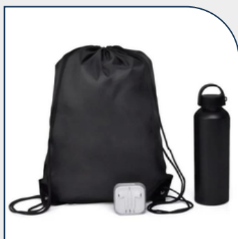
KIT BOAS VINDAS 3 PÇS PERSONALIZADO