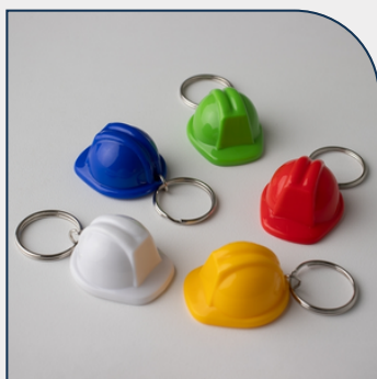
CHAVEIRO DE PLÁSTICO PERSONALIZADO CAPACETE EPI