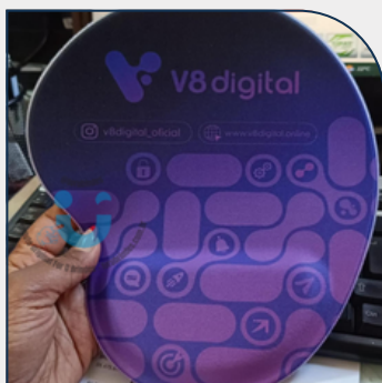
MOUSE PAD PERSONALIZADO COM APOIO